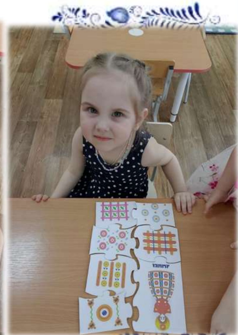
Народные промыслы в пазлах (гжель, хохлома, дымковская игрушка)