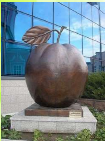
Россия г. Курск