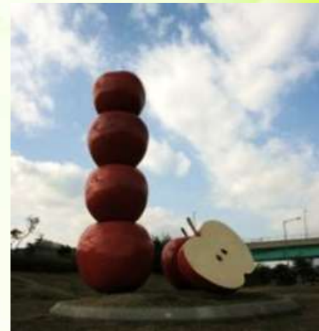
Яблочная башня в Корее